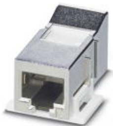
RJ45耦合连接器，类型: RJ45，保护等级: IP20，位数: 8，1 Gbps，CAT6，标识材料: 锌压铸，接线方式: 母头

Please be informed that the data shown in this PDF Document is generated from our Online Catalog. Please find the complete data in the user's documentation. Our General Terms of Use for Downloads are valid ( http://download.phoenixcontact.com )