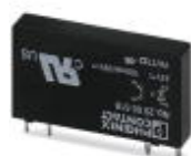
插拔式微型固态继电器，输入固态继电器，1个常开触点，输入：24 V DC，输出：3 - 48 V DC/100 mA