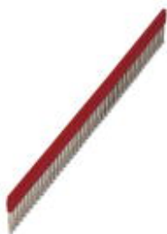
Puente enchufable, paso: 5,2 mm, número de polos: 50, color: rojo

Tenga en cuenta que los datos indicados aquí proceden del catálogo en línea. Los datos completos se encuentran en la documentación del usuario. Son válidas las condiciones generales de uso de las descargas por Internet. ( http://phoenixcontact.es/download )