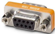
RS-232零调制解调器接头

请注意，本PDF文档中所示数据均生成自在线目录。完整数据请见用户文档。我们的一般下载使用条款已生效。