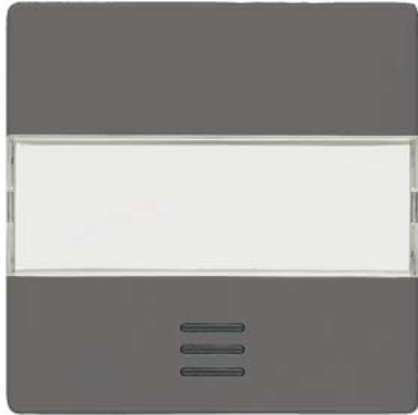
DELTA i-system carbonmetallic Wippe mit Schriftfeld und Fenster 55x55mm