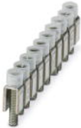
Feste Brücke, Rastermaß: 6 mm, Polzahl: 10, Farbe: silberfarben

Bitte beachten Sie, dass die hier angegebenen Daten dem Online-Katalog entnommen sind. Die vollständigen Informationen und Daten entnehmen Sie bitte der Anwenderdokumentation. Es gelten die Allgemeinen Nutzungsbedingungen für Internet-Downloads. ( http://phoenixcontact.de/download )