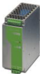
Fuente aliment. carr. simétr., 24 V DC/5 A, conmutada primario, monof.

Tenga en cuenta que los datos indicados aquí proceden del catálogo en línea. Los datos completos se encuentran en la documentación del usuario. Son válidas las condiciones generales de uso de las descargas por Internet. ( http://phoenixcontact.es/download )