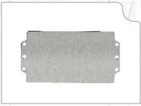
Plaques de montage