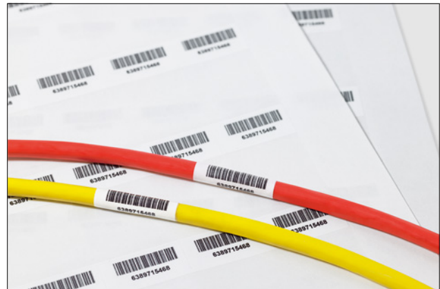
La protection transparente offre une identification durable.