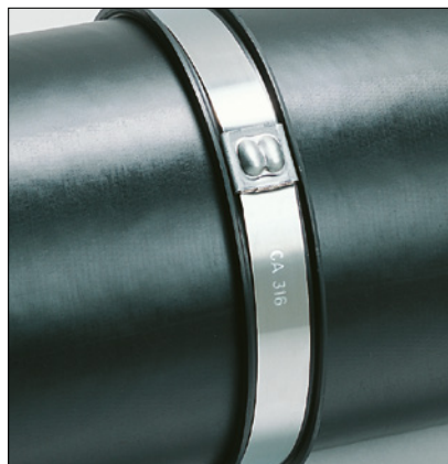
Bridas MBTXH con protector LFPC.

Las propiedades de protección al fuego, están realizadas sobre la materia prima, y definidas sobre el Test de muestra. Este está realizado en condiciones de laboratorio, siendo no transferibles al producto final ya fabricado.