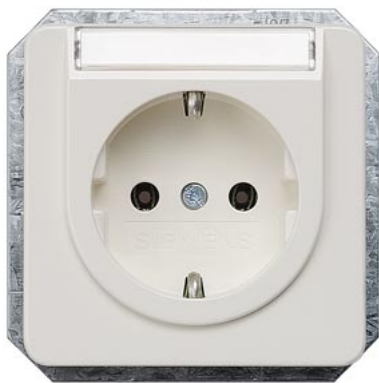
DELTA profil titanweiß SCHUKO mit Schriftfeld 10/16A 250V 65x 65mm