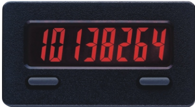
CUB 7T in Originalgröße ( mit roter Hinterleuchtung )

Der CUB 7T erfasst die Betriebszeit von Maschinen und Anlagen. Die Ansteuerung erfolgt je nach Ausführung über einen Schaltkontakt oder eine angelegte Spannung. Der CUB 7T verfügt über 9 verschiedene Zeitbereiche, die über die Fronttasten eingestellt werden. Eine Rückstellung ist über die Fronttaste und einen externen Eingang möglich. Der Sensoranschluss erfolgt über Kabelenden oder über optionale Klemmleisten.