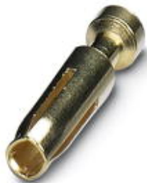
圧着2.5マシンコンタクト、個別のCuNiメスコンタクト、芯線断面積0.5 mm 2 、コーティングなし

このPDF文書に表示されているデータはフェニックス・コンタクトのオンラインカタログから作成したものです。全データはユーザーマニュアルに記載されています。ダウンロードの規定は有効です ( http://phoenixcontact.jp/download )