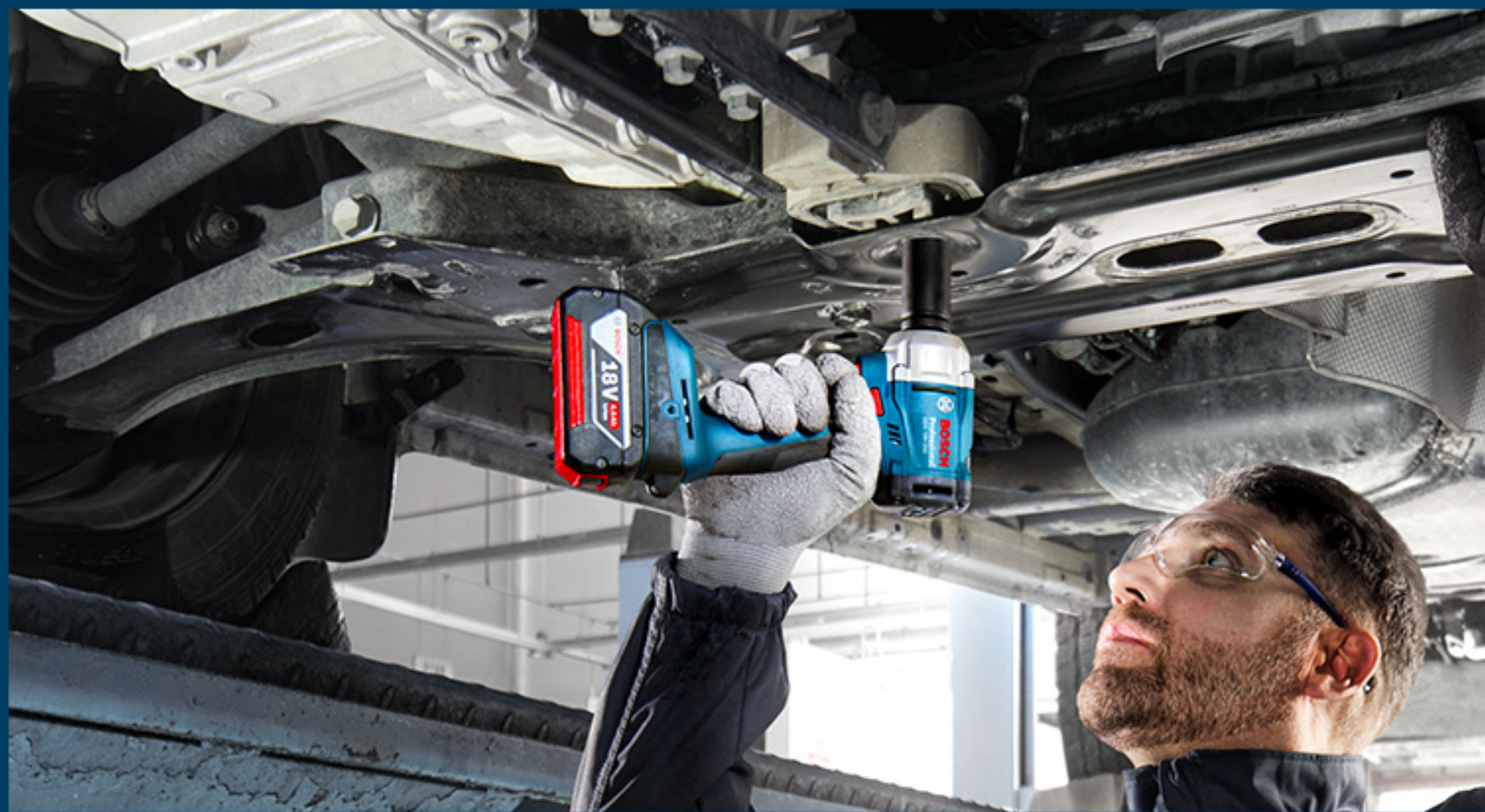
机械车辆保养维修