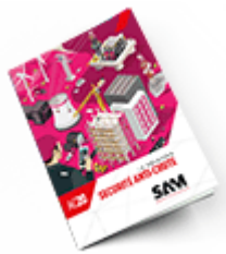
Sécurité anti-chute 2020