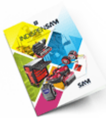
Les outils Indispensables SAM 2021