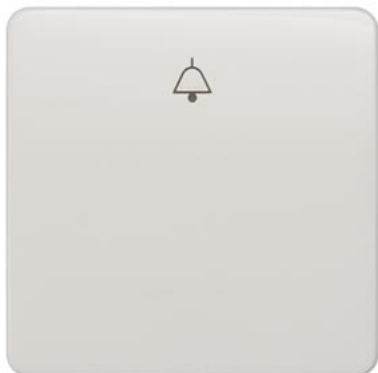
DELTA profil titanweiß Wippe mit Symbol Glocke 65x65mm