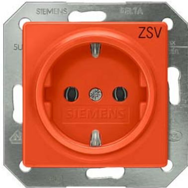
DELTA i-system orange SCHUKO mit Bedruckung "ZSV" 55x55mm 10/16A 250V