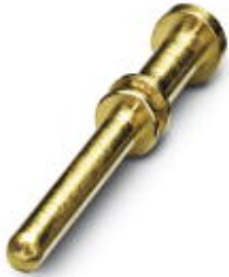
压接插针，车削，单个插针，触点直径: 2 mm，压接范围: 1 mm 2 ... 2.5 mm 2

Please be informed that the data shown in this PDF Document is generated from our Online Catalog. Please find the complete data in the user's documentation. Our General Terms of Use for Downloads are valid ( http://download.phoenixcontact.com )