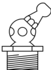
H2 type 45°