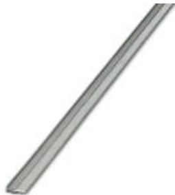
連続プラグインブリッジ、長さ: 500 mm、色: 灰

このPDF文書に表示されているデータはフェニックス・コンタクトのオンラインカタログから作成したものです。全データはユーザーマニュアルに記載されています。ダウンロードの規定は有効です ( http://phoenixcontact.jp/download )