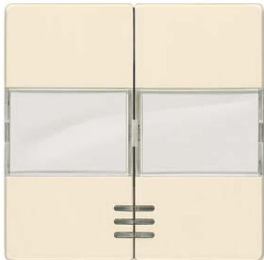
DELTA i-system elektroweiß Wippe 2-fach mit Schriftfeld und Fenster 55x55mm