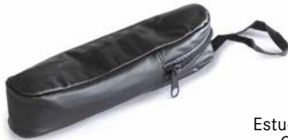
Estuche de piel ORA-A2103