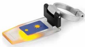
Tapa Prisma ORA-A1101