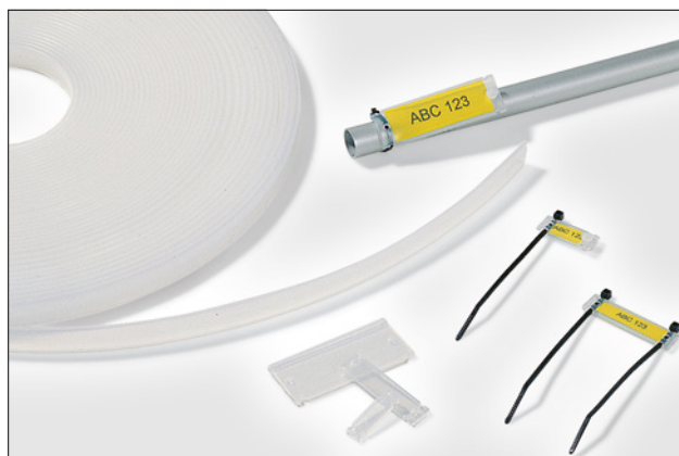
Helafix HC et HCR.