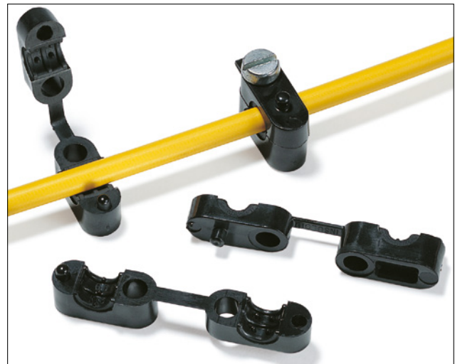
Klam-Klip Retenedores de Cable.