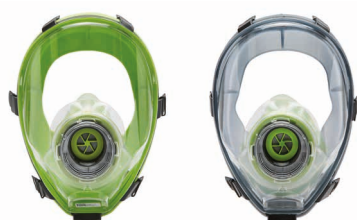
Masques complets BLS 5400 - BLS 5150