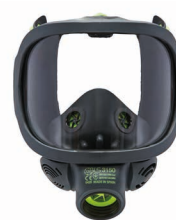
Masques complets BLS 3150