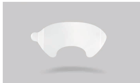
K19 – Film de protection en acétate.