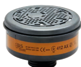
Filtres BLS 400 series