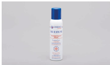
Q409 – Spray désinfectant (150ml).