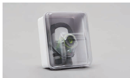
C90 – Boitier mural.