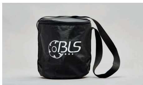
C43 – Sac textile pour demi-masques.