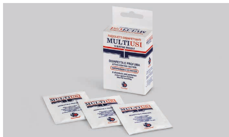
Q409 – Lingettes désinfectantes multiusages.