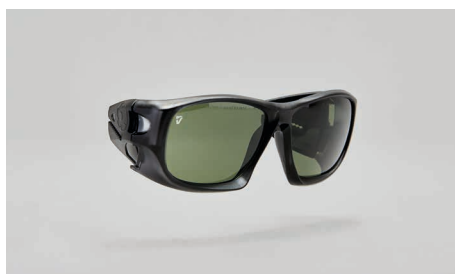
C22 – Montures pour verre de correction.