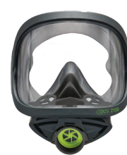
Masques complets BLS 2150/2150V