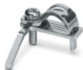
屏蔽夹，用于印刷线路板连接器