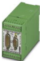
接口转换器，将RS-232 (V.24)转换为RS-422 (V.11)，带电气隔离，4通道，导轨安装式

Please be informed that the data shown in this PDF Document is generated from our Online Catalog. Please find the complete data in the user's documentation. Our General Terms of Use for Downloads are valid ( http://download.phoenixcontact.com )