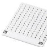
マーキングカード, カード, 白, マーキング, 横: 連番 ( 1~10、11~20など、91~100まで ), 取付けタイプ: 粘着剤, 端子台幅 : 7.62 mm, 印字エリア: 7,62 x 3,8 mm

マーキングカード - SK 7,62/3,8:FORTL.ZAHLEN - 0804549