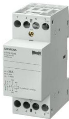
Insta-Schutz mit 3 Schließern und 1 Ö Kontakt für AC 230V, 400V 25A Ansteuerung AC 115V