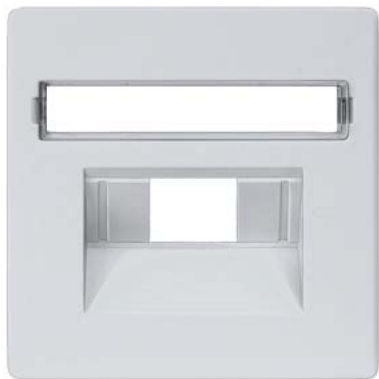
DELTA i-system aluminiummetallic Abdeckung UAE-Kat.3, 1-und 2f, Schriftfeld