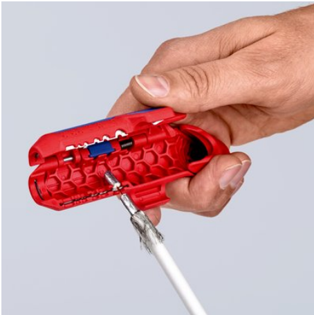
Dénudage d'un câble coaxial