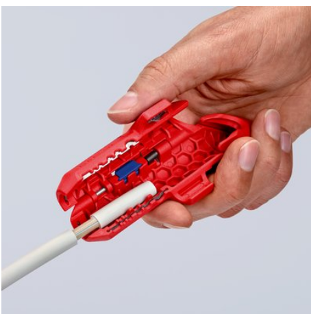
Dégainage d'un câble NYM