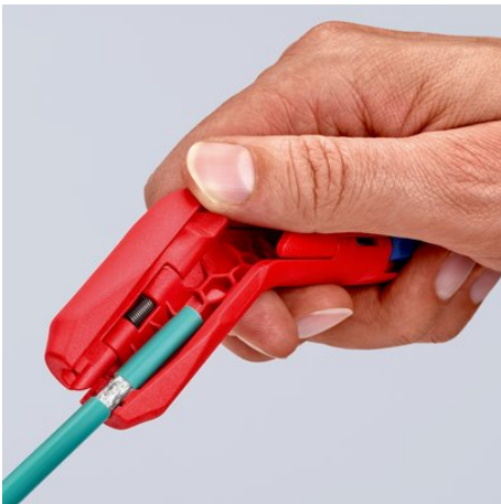
Dégainage d'un câble de données