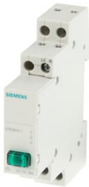
Leucht- / Phasenmelder 1x LED, 12..60V grün