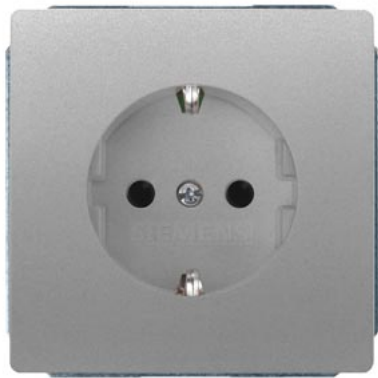
DELTA style platinmetallic SCHUKO mit Kinderschutz 68x68mm 10/16A 250V