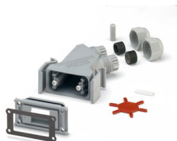
D-SUB-Steckverbinder-Set, Shell-Größe 3, ungeschirmt

Bitte beachten Sie, dass die in diesem PDF-Dokument angezeigten Daten aus unserem Online-Katalog generiert wurden. Bitte finden Sie die vollständigen Daten in der Benutzer-Dokumentation. Es gelten unsere Allgemeinen Nutzungsbedingungen für Downloads.