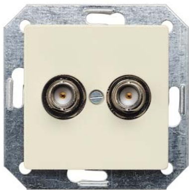
DELTA i-system elektroweiß BNC-Steckbuchse 2-fach 75 Ohm 55x55mm