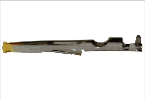
图片仅用于说明。请参考产品描述。