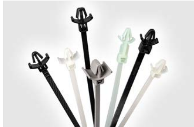
Assortiment de lanières monoblocs à pied ancre avec ailettes.