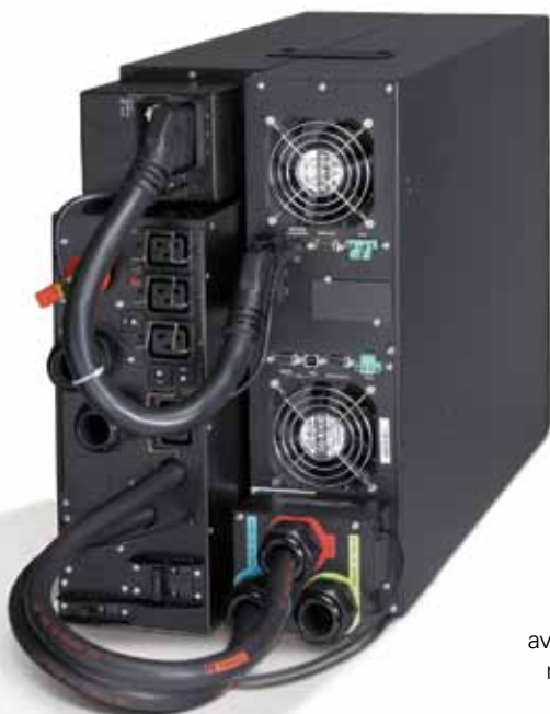
9PX 11kVA avec bypass de maintenance.