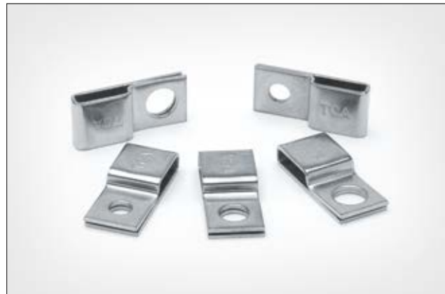
Edelstahlsockel der SSPC-Serie für Anwendungen in rauen Umgebungen.