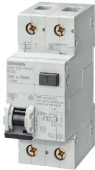
FI/LS-PROTECTOR TYPE A (PSE/SSF), D=70MM IFN 30MA,6KA, 1+N-POLEE C 10A