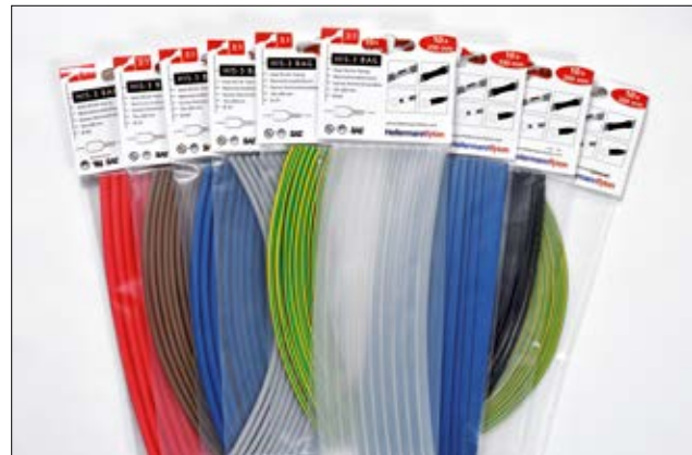
HIS-3 BAG ist in sieben Farben und vier Abmessungen erhältlich.