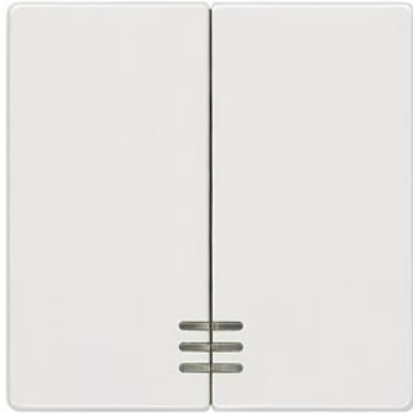
DELTA i-system titanweiß Wippe 2-fach mit Fenster 55x55mm