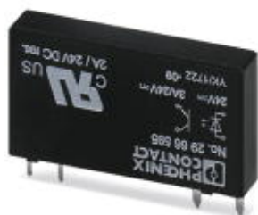
插拔式微型固态继电器，功率型固态继电器，1个常开触点，输入：24 V DC，输出：3 ... 33 V DC/3 A

Please be informed that the data shown in this PDF Document is generated from our Online Catalog. Please find the complete data in the user's documentation. Our General Terms of Use for Downloads are valid ( http://download.phoenixcontact.com )