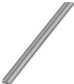
Endlossteckbrücke, Länge: 500 mm, Farbe: grau

Bitte beachten Sie, dass die hier angegebenen Daten dem Online-Katalog entnommen sind. Die vollständigen Informationen und Daten entnehmen Sie bitte der Anwenderdokumentation. Es gelten die Allgemeinen Nutzungsbedingungen für Internet-Downloads. ( http://phoenixcontact.de/download )