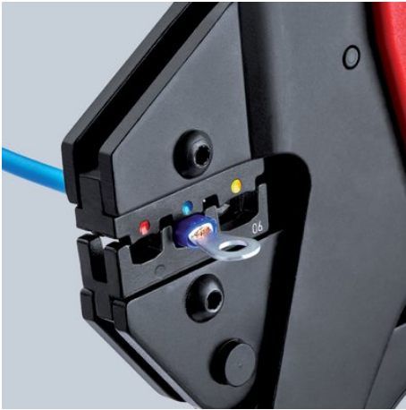
97 43 200 mit Crimpeinsatz 97 49 06 für isolierte Kabelschuhe, Steckverbinder und Stoßverbinder

97 43 200 mit Crimpeinsatz 97 49 09 für Aderendhülsen 97 43 200 mit Crimpeinsatz 97 49 06 für isolierte Kabelschuhe, Steckverbinder und Stoßverbinder