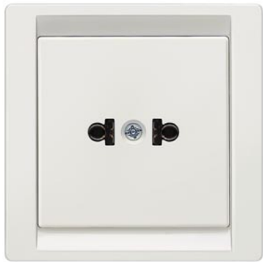
DELTA style titanweiß SCHUKO 15A 125V amerikanischen Standard C73