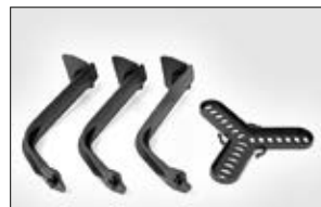
SpotClip-Kit 150 wird als Montageset geliefert.