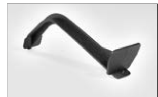
Ein robustes Design in Verbindung mit Haltedornen sorgt für hohe Stabilität.