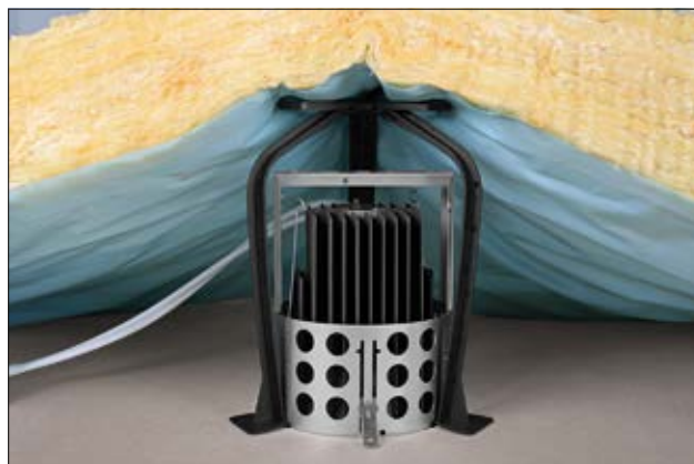
SpotClip-Kit 240 im Einsatz mit festem Dämmmaterial.