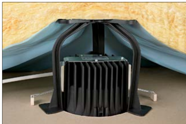
SpotClip-Kit 150 eingebaut in einer abgehängten Decke.

SpotClip-Kit wurde als Abstandshalter für Einbaustrahler mit größeren Abmessungen in Büro- und Industriegebäuden konzipiert. Der Verpackungsinhalt besteht aus drei Beinen und einer Montageplatte. Die Beine sind in zwei verschiedenen Längen (150 mm und 240 mm) erhältlich. SpotClip-Kit verfügt über sechs frei wählbare Steckplätze in der Montageplatte, sodass der Abstandshalter für Einbaustrahler mit unterschiedlichen Abmessungen geeignet ist.