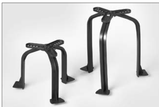
Der Abstandshalter SpotClip-Kit ist in zwei unterschiedlichen Größen erhältlich.