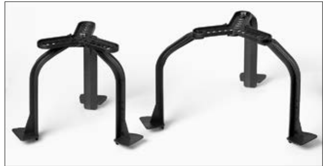
SpotClip-Kit 150 zum Fixieren in Montageöffnungen von 100 mm bis 270 mm.

Alle Maße in mm. Technische Änderungen vorbehalten.