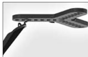
Der benötigte Einbaudurchmesser kann durch die variablen Steckplätze leicht angepasst werden.