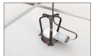
4. Einbaustrahler mit Stromkabel verbinden und Leitung an der Kabelführung befestigen.