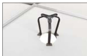
2. SpotClip-Kit positionieren und mit den Haltedornen gegen Verrutschen sichern.