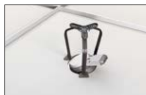
3. Installation des Einbaustrahlers gemäß Bedienungsanleitung des Herstellers.