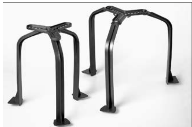
SpotClip-Kit 240 zum Fixieren in Montageöffnungen von 170 mm bis 310 mm.