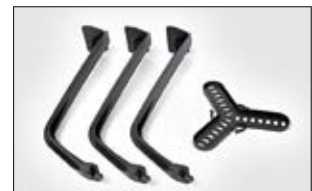
SpotClip-Kit 240 wird als Montageset geliefert.