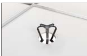
1. Zusammendrücken der SpotClip-Kit Beine zum leichteren Einsetzen in der Montageöffnung.