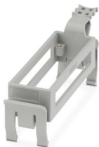
导轨安装支架，类型: B24，用于插芯，顶部支架

请注意，本PDF文档中所示数据均生成自在线目录。完整数据请见用户文档。我们的一般下载使用条款已生效。