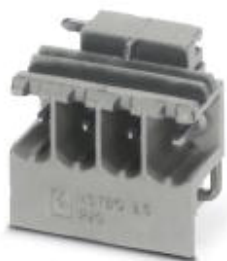
ソケット, 定格電流: 16 A, 定格電圧 ( III/2 ) : 320 V, 極数: 4, ピッチ: 5 mm, 取付け方法: ハンダ接続

このPDF文書に表示されているデータはフェニックス・コンタクトのオンラインカタログから作成したものです。全データはユーザーマニュアルに記載されています。ダウンロードの規定は有効です ( http://phoenixcontact.jp/download )