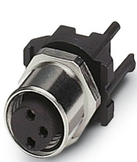
设备连接器 板后安装，3-位置，孔式，直头，M8，编码: A，板后安装，M8 x 1，波峰焊

请注意，本PDF文档中所示数据均生成自在线目录。完整数据请见用户文档。我们的一般下载使用条款已生效。