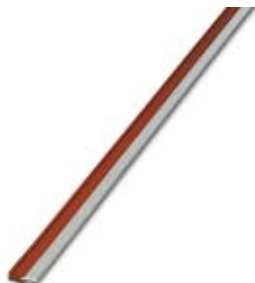
Puente enchufable sin fin, longitud: 500 mm, color: rojo

Tenga en cuenta que los datos indicados aquí proceden del catálogo en línea. Los datos completos se encuentran en la documentación del usuario. Son válidas las condiciones generales de uso de las descargas por Internet. ( http://phoenixcontact.es/download )